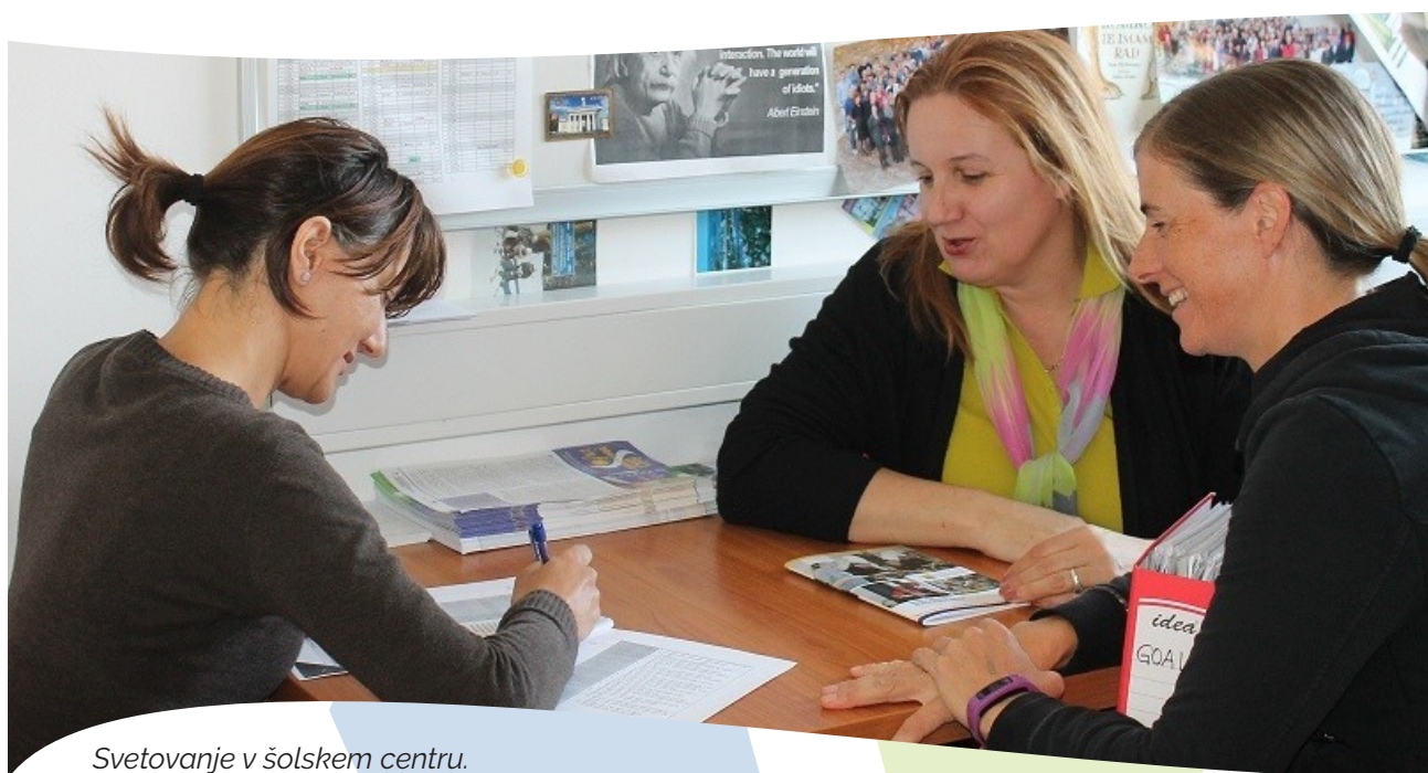
Svetovanje v šolskem centru.

c. Utrjevanje odločitve: identifikacija z izbiro in izvedbo